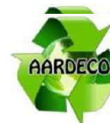
Gráfico No 1 ÁREA DE PRESTACIÓN DE SERVICIO DE AARDECO